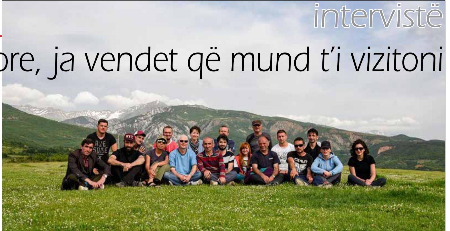
Një falënderim për anëtarët e një grupi të mrekullueshëm, të cilët na morën në Liqenin e Gramës. Një eksperiencë e mrekullueshme kampingu në Malin e Korabit, ku prapa supeve tuaja shkëlqen perëndimi i diellit. Jam me të vërtetë i kënaqur që kam ndarë këtë udhëtim me Ju dhe me një "bandë të tërë mushkonjash".

- Trajnimi im ka qenë shumë i vlefshëm për mua. Kam mësuar shumë gjëra në pak kohë dhe njëkohësisht më ka krijuar hapësira të reja se si mundet në të ardhmen të menjohet për investime në këtë sektor.