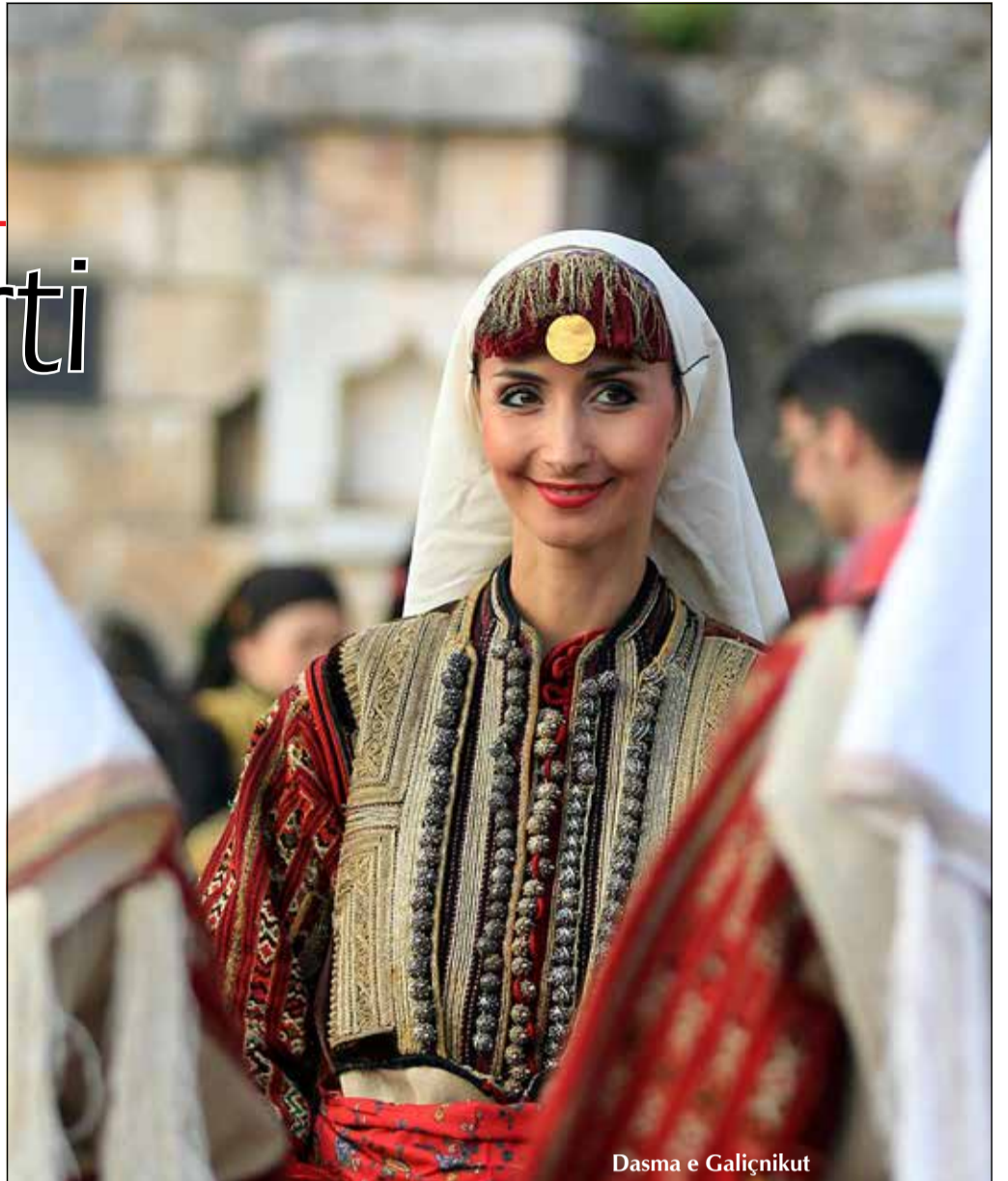
Dasma e Galiçnikut

Manastiri Shën Gjergji Fitimtari. Kisha Shën Gjergji Fitimtari në fshatin Rajçicë, gjendet në dy kilometra prej qytetit të Dibrës - dikur seli e Manastirit të Bigorskit, sot është manastir i urdhërit të murgeshave. Tek manastiri, i qëndron kohës kisha Shën Gjergji Fitimtari e ndërtuar në