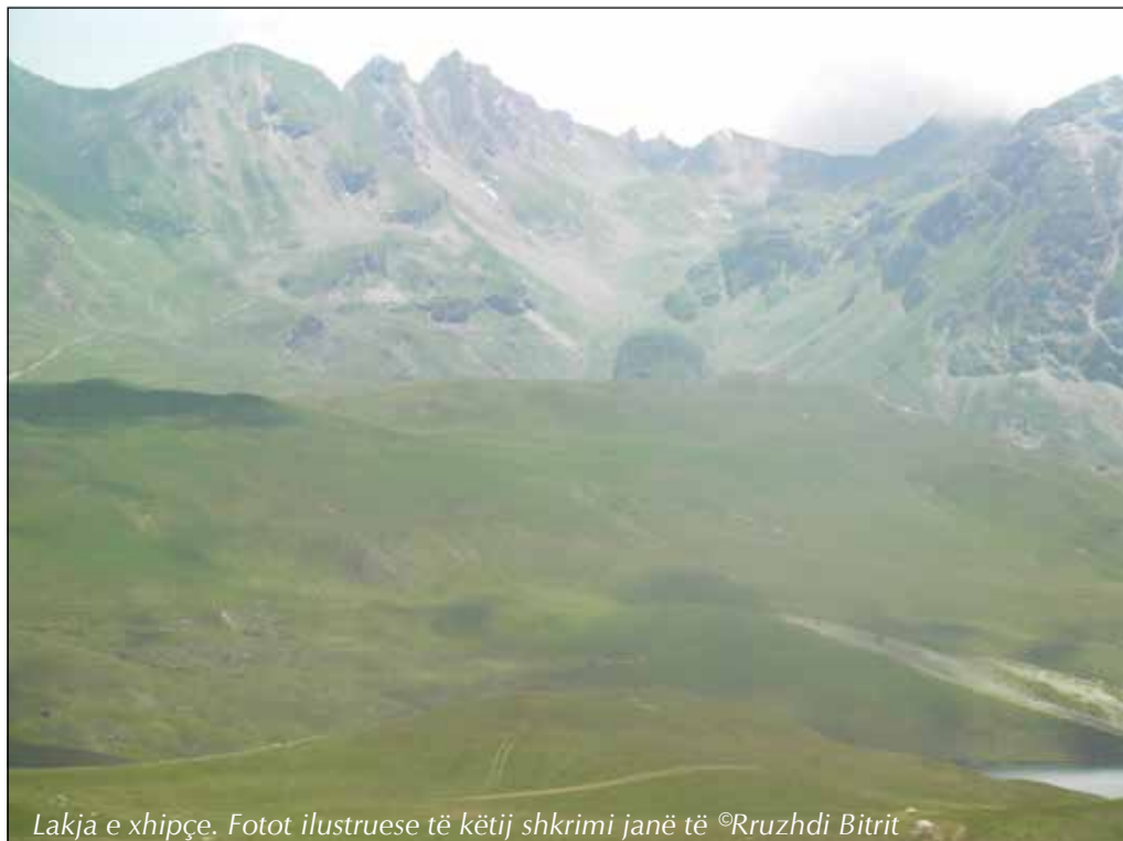
Lakja e xhipçe.

Një turist do të na thoshte "Po kaq i çmendur ka qenë ai regjim që ka bërë një rrugë me gjatë 2 km në fund të malit vetëm që të mos shkelë njeri. "Rrugë" që të jetë ndaluar ecja në të, vetëm këtu kam parë.