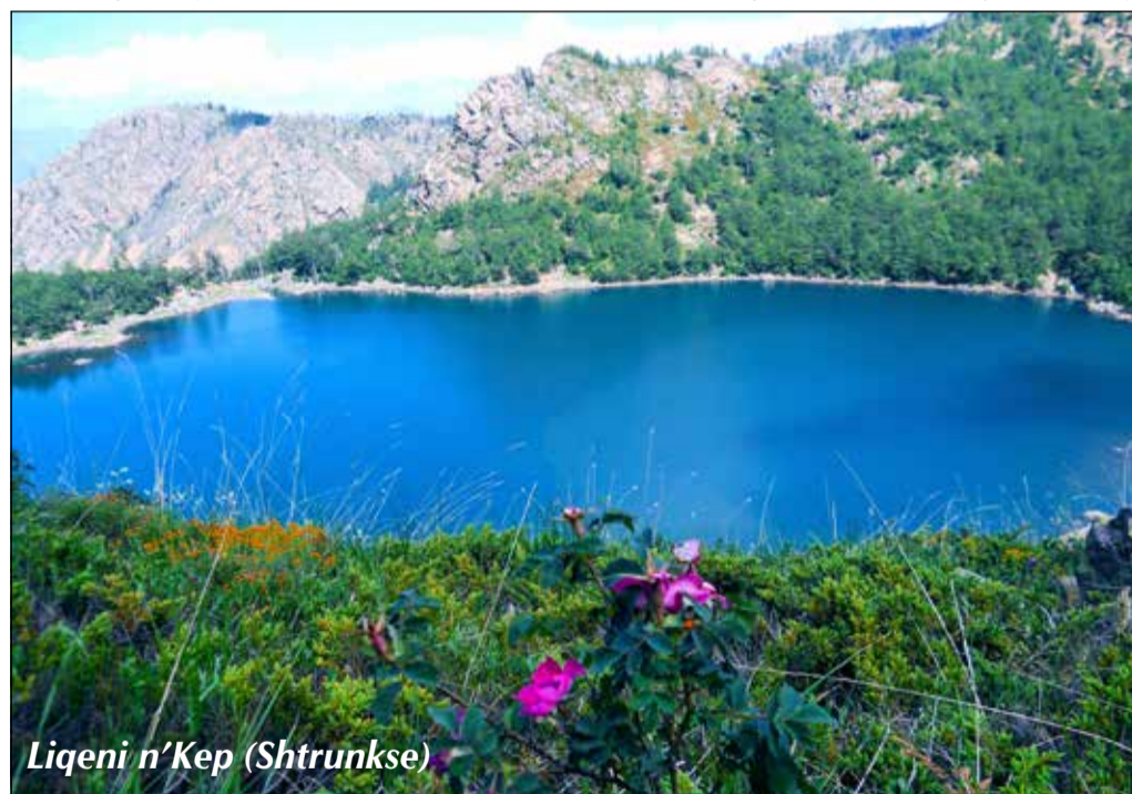
Liqeni n'Kep (Shtrunkse)

Ftojmë ta vizitoni këtë vend vetëm një herë ata që janë të pasionuar në ngjitjen e lartësive, ata që kanë vendosur që seriozisht të eksplorojnë natyrën e virgjër shqiptare, ata që vërtet dëshirojnë të shijojnë ajrin plot oksigjen, ujin e kristaltë të lartësive e natyrën plot ngjyra. Ju siguroj se nëse ka një herë të parë, patjetër do të ketë një herë të dytë.