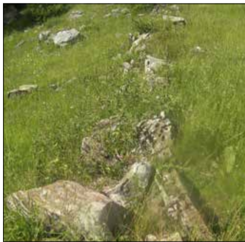
Gjurmë vendbanimesh të hershme