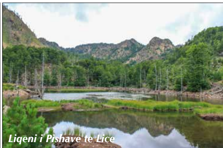
Liqeni i Pishave te Lice