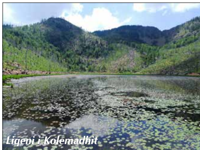
Liqeni i Kolemadhit