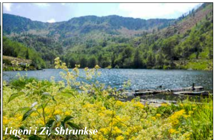
Liqeni i Zi, Shtrunkse