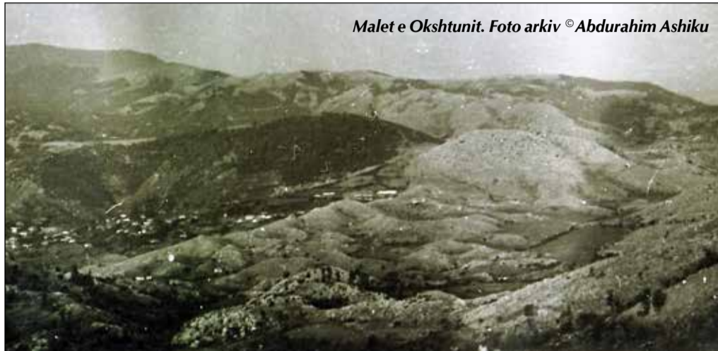
Malet e Okshtunit.

Okshtuni, i ndodhur në kufi të tre rretheve dhe nën trysinë e vazhdueshme të ambicieve