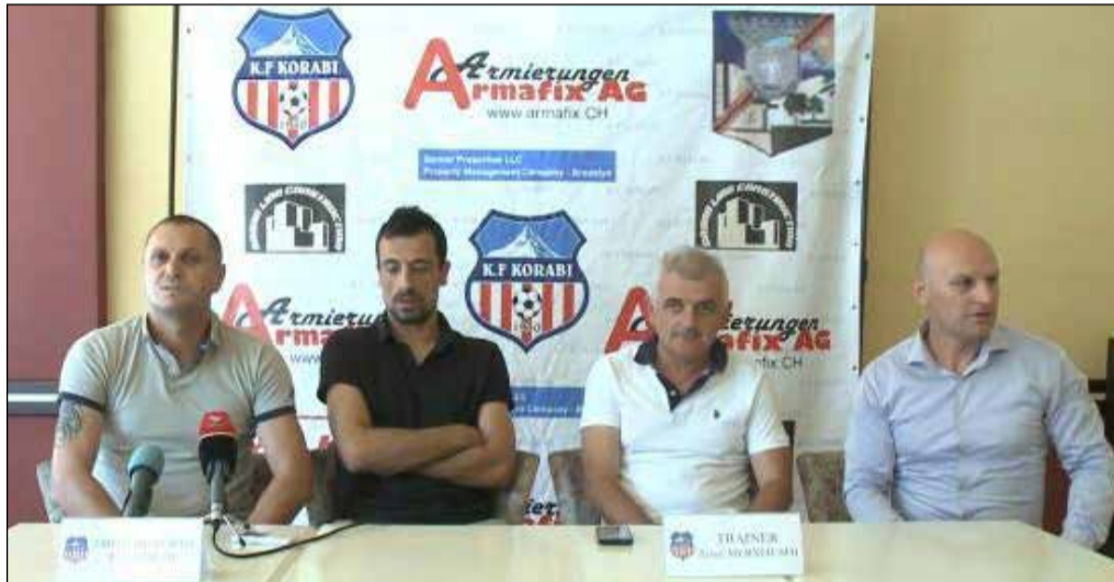
Drejtesit e Korabit gjatë një konference shtypi