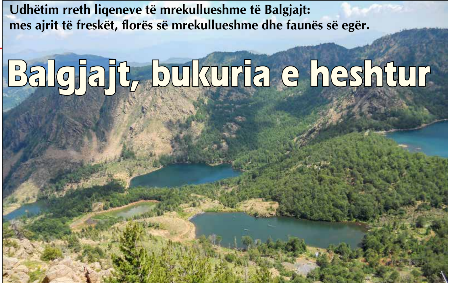
Pesë liqenet e Shtrunksës.

Pasi të jesh miqësuar me këtë vend që ngërthen plot tregime e gojëdhëna, kureshtja të shtyn për ta eksploruar më tej, ku mendja