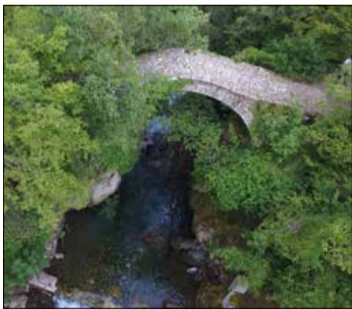
Në foto: Hamami i Dibrës, Ujëvara e Dufit dhe Ura e Kaprollit.