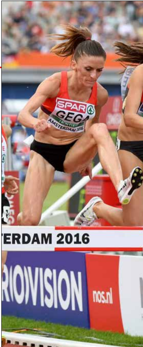
Foto nga garat ku u shpall nënkampione e Europës

- Bëre mirë që ma bërë këtë pyetje, sepse edhe pse e kam sqaruar në shumë ekrane televizive apo gazeta, dua të ritheksoj përsëri: Në Rinas më priten jo autoritetet e larta zyrtare të shtetit, por drejtuesit e federatës, të drejtorisë së sporteve në ministri dhe mbi të gjitha shumë qytetarë dhe fansa. Arsyeja që m'nguan drejtuesit e lartë të shtetit, apo ministrisë, siç e mora vesh më vonë, ishte fakti që duhej të mos ndodhte ndonjë problem si me peshëngritjen, që pasi i pritën me pompozitet, ardhja e përgjigjeve për doping ndryshoi gjithçka dhe s'ju njohu as rezultatet e arritura, madje i shkurorëzoi nga medaljet. Ndaj, nuk donin që kjo të ndodhte as me mua, deri në prite të përgjigjeve të analizave për doping, që zgjasin disa ditë pas gare. Gjithsesi, kjo për mua kishte pak rëndësi. Me rëndësi ishte ardhja në aeroport e shumë njerëzve të thjeshtë, saqë se besoja kur dola nga mjedisi i aeroportit. Lule e pankarta në duar, fjalë mirëseardhje, gazetarë me kamera dhe shume fotoreporterë. Vërtet, nuk kishte gjë më të bukur. U ndjeva shumë e lumtur dhe mu duk se kishte dalë gjithë Shqipëria aty. Aq u emocionova, saqë nuk dalloja dot as motrat dhe njerëzit e familjes sime... Vetëm lotoja prej gëzimit dhe faktit që i bëra këta njerëz kaq të lumtur. Pasi dhashë intervistat, ku ju ishit prezent, u futëm në një limuzinë, që presidenti i Federatës së