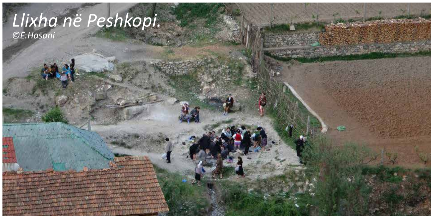
Llixha në Peshkopi.

Lokalet e dasmave janë hapur para kohe. Jo për dasma, sigurisht, por për takime elektorale. Dhe si gjithmonë, kryebashkiaku i ardhshëm është ulur në vendin e dhëndrit, ndërsa nusja pritet të vijë me 22 qershor. Mund edhe të mos vijë, sepse varët se si sillen dasmorët.