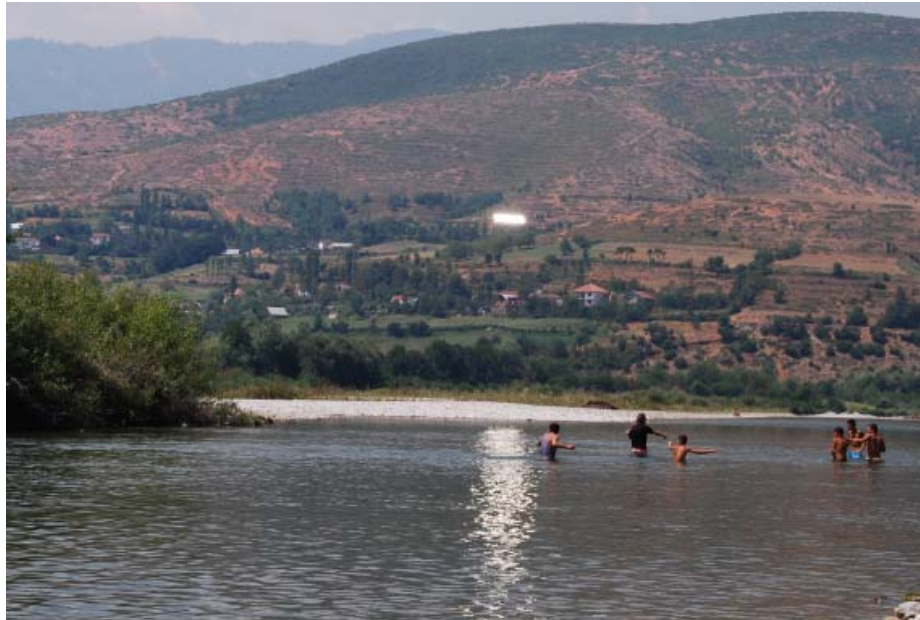
Drini i Zi

A duhet të kalojë linja e re e gazit dhe e naftës nëpër Vlorë drejt Italisë kur distanca tokësore midis këtyre dy pikave është më e shkurtra ? A duhet që Vlorës si alternativë të vetme t'i jepet që energjinë elektrike ta prodhojë në bregde-