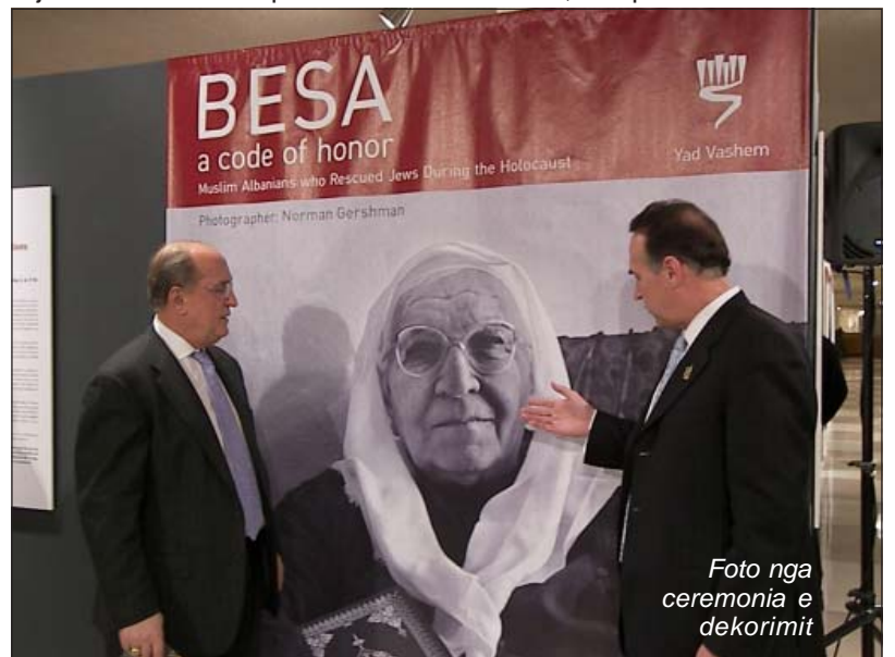
Foto nga ceremonia e dekorimit

Unë do të ju jap një shëmbull midis mijërave familje shqiptare, vetëm familja ime që mbrojtë jetë hebrejsh dhe sot si këtu në New York, edhe në Paris, u nderuan për këtë vlerë humane, ata pësuan holokaustin