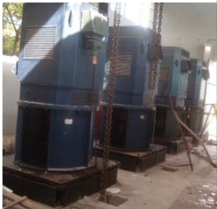
Në foto: Pamje nga stacioni i shkaktuar i motopompave.