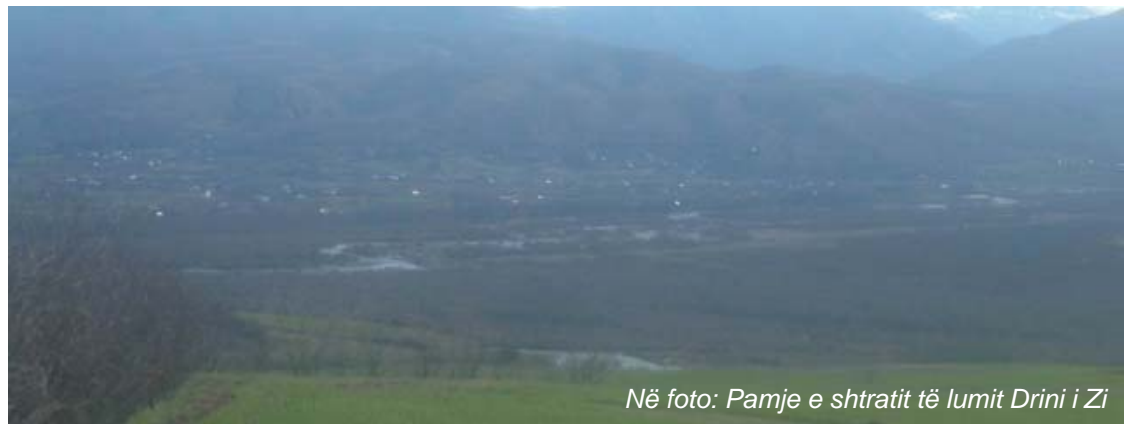
Në foto: Pamje e shtratit të lumit Drini i Zi

Dibër e Madhe - Në rripin kufitar Shqipëri-Maqedoni