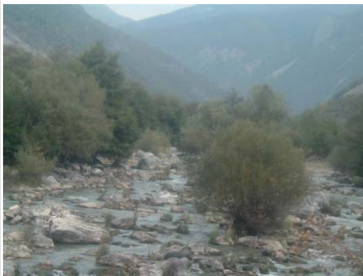
Pamje e Grykës së Radikës që i ka mbetur Dibrës

Kjo tkurrje, përveç saktosjes territoriale, i ka sjellur Dibrës edhe dëme të mëdha në zhvillimin ekonomik dhe bujqësor. Si pasojë të tërë kësaj kemi një mërgim intensiv në tërë botën e më së shumti gati 15 mijë dibranë që jetojnë e punojnë në SHBA.