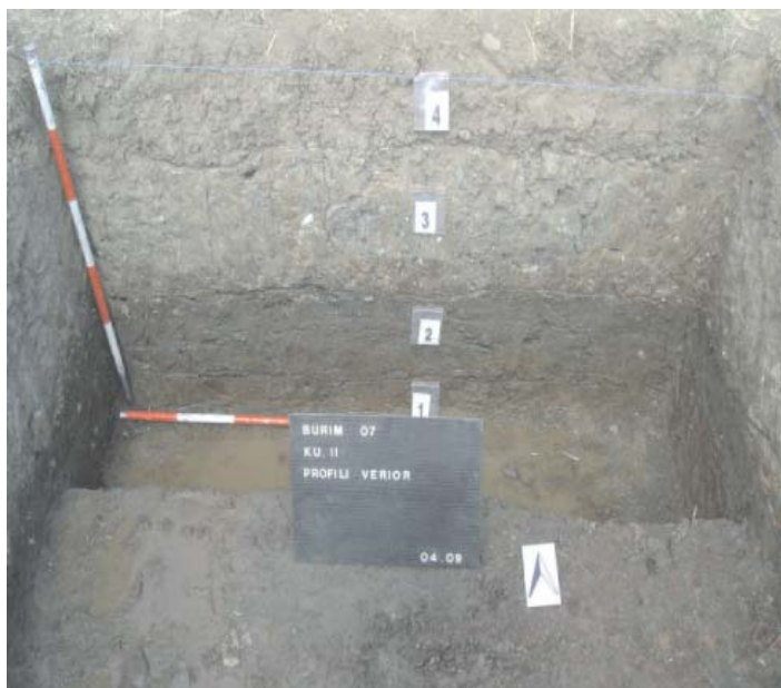
Fig.2. Profili verior i kuadr. II

Lënda arkeologjike e zbuluar është relativisht e pasur. Ajo përbëhet kryesisht nga fragmentet e enëve, veglat e punës prej guri dhe stralli, ndërsa mungojnë në pjesën e gërmuar veglat prej balte dhe