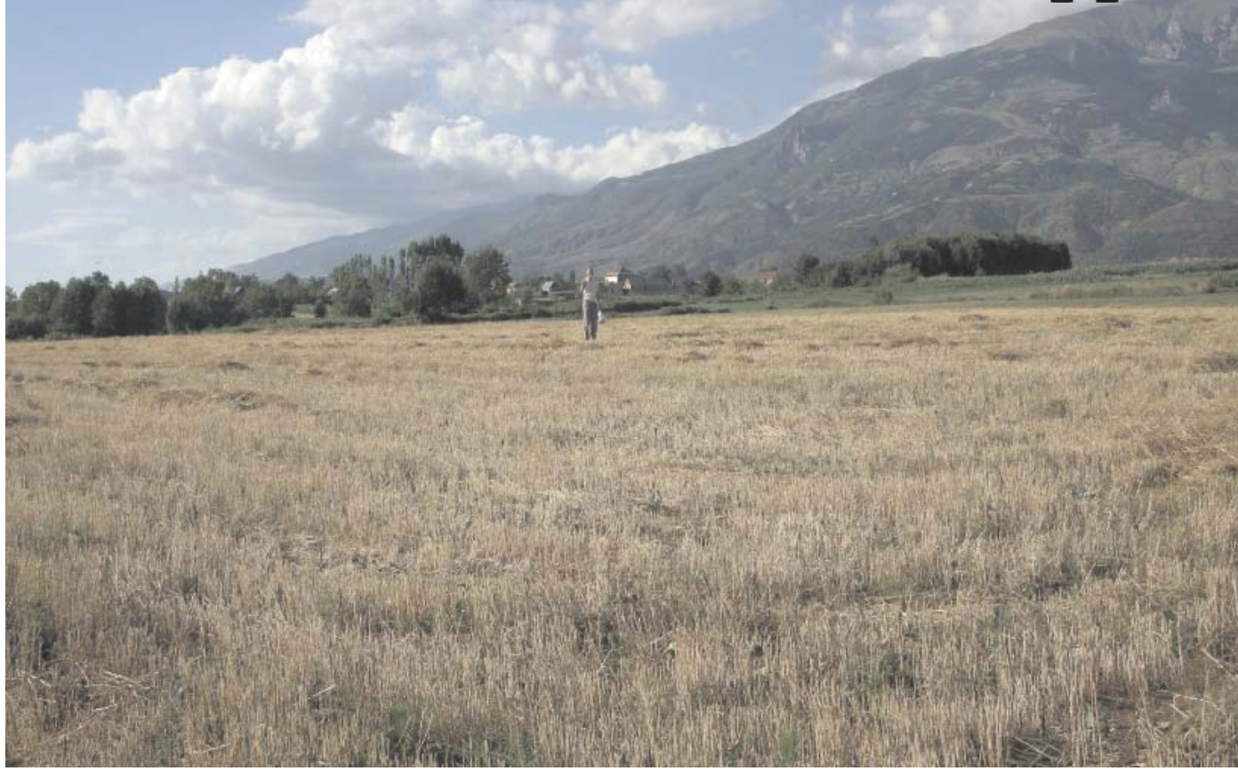
Fig.1. Pamje e përgjithshme e vendbanimit të Burimit

nin natyror argjilo-flislor të vendbanimit. Meqenëse niveli hidro-stratik i ujrave është i lartë, banorët e hershëm neolitik të Burimit, kanë ndërtuar banesat e tyre, duke synuar hidroizolim sa më efikas të të dyshemeve të banesave të tyre. Kështu, në fillimet e jetës së këtij vendbanimi, këto dysheme janë ndërtuar nga një platformë e rallë kalldrëmore gurësh të vegjël lumorë, të plotësuar edhe me fragmente të ralla enësh, mbi të cilët ka qenë shtuar një shtresë llaçi argjilor, e cila nuk ruhet gjithnjë e plotë (fig. 3-Pamje nga dyshemeja e kuadr. III). Shtresa e dyshemesë argjilore, me trashësi 8-10 cm e gatuar prej argjili të pastruar nga gurët dhe të përzier me byk gruri, është e pjekur dhe ka ngjyrë të kuqe tulle. Kjo teknikë e ndërtimit të dyshemeve neolitike të hershme, përveç Burimit, është konstatuar edhe në mjaft vendbanime neolitike të Shqipërisë si në atë të Topojanit (gradishta e Vojnikës-Dibër), Kosovës, si në atë të Vlashnjës (Prizren), Rudnikut (Skënderaj), në disa vendbanime të Thesalisë e Maqedonisë etj. Dyshemeja kalldrëmore e Burimit shquhet për një teknikë fillestare të ndërtimit të saj. Gurët lumorë të madhësisë mesatarë e të vegjël janë të rallë dhe nuk e mbulojnë të gjithë sipërfaqen e dyshemesë. Boshllëqet midis tyre janë mbushur me argjil të pjekur në