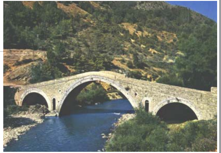
Urë e dikurshme mbi lumin Radika

Para se të vendosej ky kufi famëkeq, Dibra e Madhe ish-