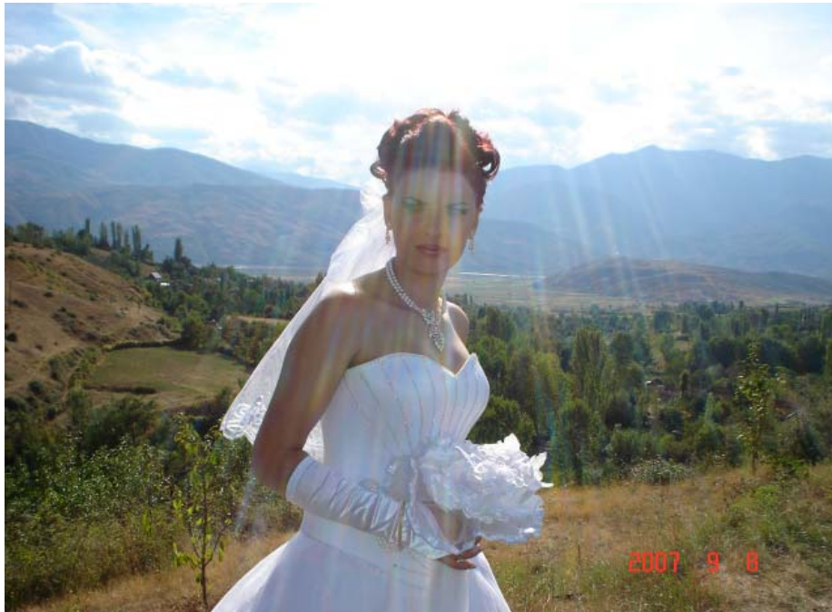
Kujtim nga vendlindja

Do të desha ta jetoja atë ditë ashtu siç do të deshën ta jetonin dibranët, tetovarët, kosovarët. Është arteri më jetik i shqiptarëve të ndarë pas arterit të rrugës Durrës - Morinë. Nuk e di në se e kuptojnë këtë gjë politikanët tanë, jo në fushata zgjedhesh ku deklarata dhe përrurimet e fillimit të punimeve nuk kanë munguar, por në plane perspektive, me kohë e afate të caktuara, me investime të shtetit apo me koncesione. Rrugët