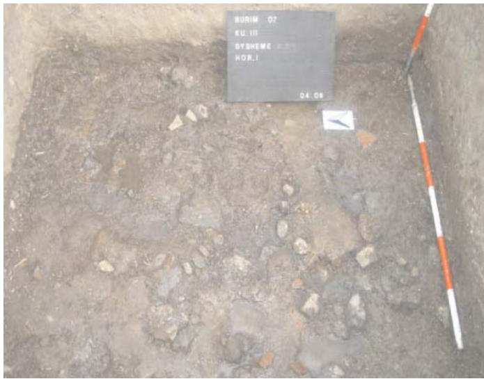
Fig.3. Pamje nga dyshemeja kalldrëmore e kuadr. III

Në këtë kontekst, Burimi do të përfaqësojë shfaqjen më të hershme të zhvillimit të neolitit të hershëm qeramik