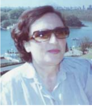
Nga VITA KOJA*

Turizmi është një dukuri që shoqërohet me spostimin e njerëzve nga një rajon që quhet destinacion emetues, drejt një rajoni tjetër (destinacioni pritës) për një kohë të caktuar... Në destinacionin turistik, turisti zhvillon një sërë veprimtarish, provokon investime, bën vlerësimin e ekonomik të bukurive natyrore të zonës, etj..