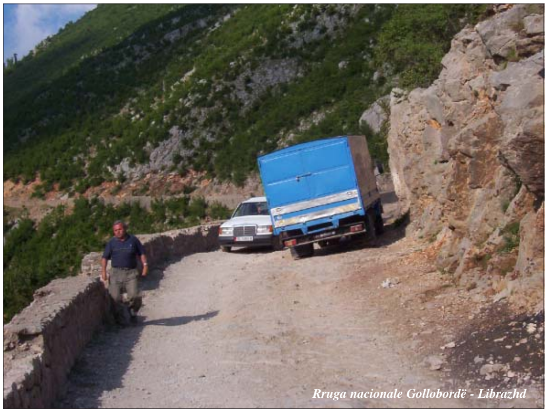
Rruga nacionale Gollobordë - Librazhd

Rruga na nxjerrë në krah të Ostrenit të Vogël, një fshat që duket sikur është mbërthyer fort me thonj në shpatin e pjerrët të një kodre të zhveshur për të mos rrëshkitur poshtë në