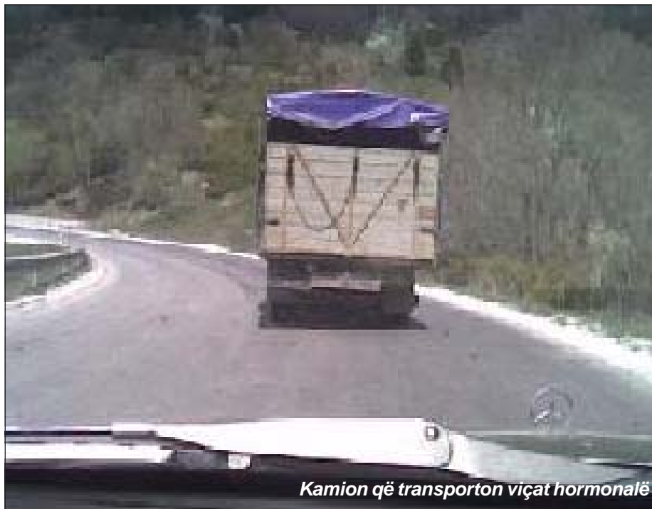
Kamion që transporton viçat hormonalë