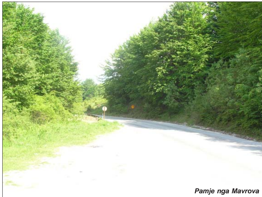
Pamje nga Mavrova

2. Vazhdimi i autostradës Rruga e Arbërit me segmentin rrugor prej kufirit Shqipëri-Maqedoni deri tek