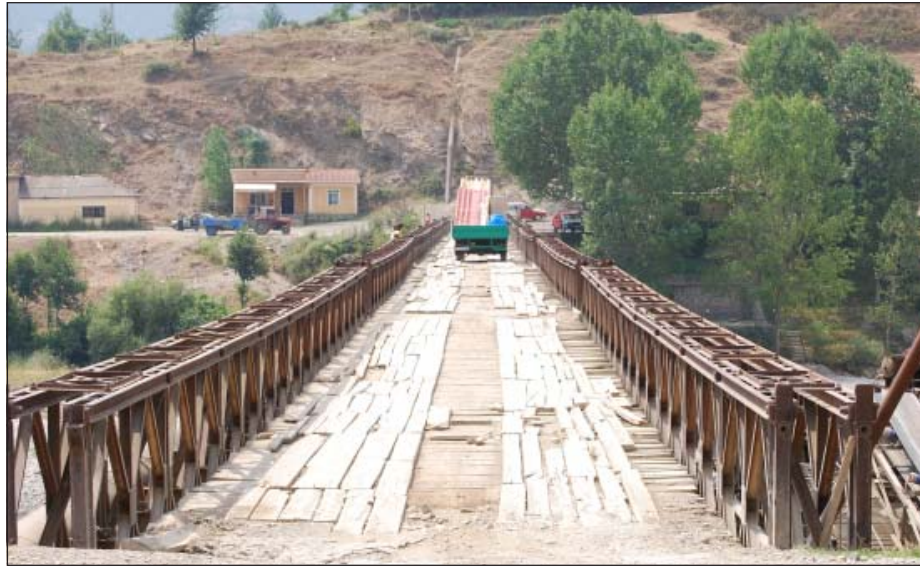
Ura e Muhurrit... ashtu siç nuk duhej të ishte...