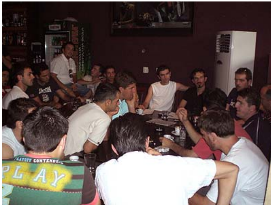
Mërgimtarët duke biseduar për projektin

Në Shtete e Bashkuara të Amerikës dhe në Evropë thuhet se jetojnë mbi 15 mijë dibranë, ndërsa nuk është i vogël as numri i atyre që jetojnë në Kosovë, Shqipëri, apo Shkup dhe Tetovë.