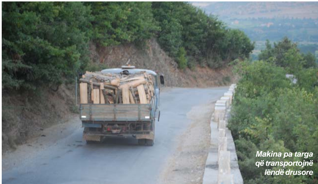
Makina pa targa që transportojnë lëndë drusore

bërë. Punëtorët e firmës që kishte fituar tenderin për ndërtimin punonin ditën, hapnin kanale e shtronin tuba dhe natën shkonin e i vidhnin tubat. Në mëngjes, sikur nuk dinin gjë, shkonin dhe shihnin se tubat ishin vjedhur. Por nuk u bënte përshtypje ky fakt. Ata vazhdonin të hapnin kanale e të shtronin tuba. Kur fshatarët u ankuan se kështu nuk po ndërtohej ujësjellësi, ata thoshin: S'kemi faj ne, vetë i keni vjedhur tubat. Ne paguhemi për t'i shtruar njëherë, jo sa herë i vidhni ju, ne t'i shtrajmë. Kështu ujësjellësi u ndërtua me “një paketë tubash” dhe fshatarët, përveç një kanali që hapej e mbyllej, ujë nuk panë në shtëpi. Dhe, natyrisht, kjo nuk është për të