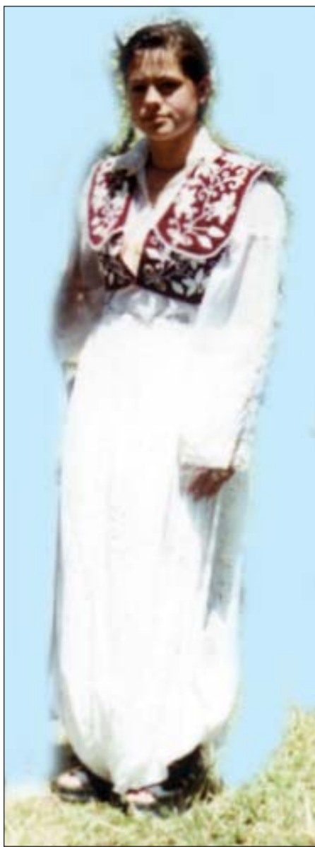
Kostum popullor nga Kalaja e Dodës

Në disa prej këtyre këngëve përmenden emra konkret, të cilëve u drej-