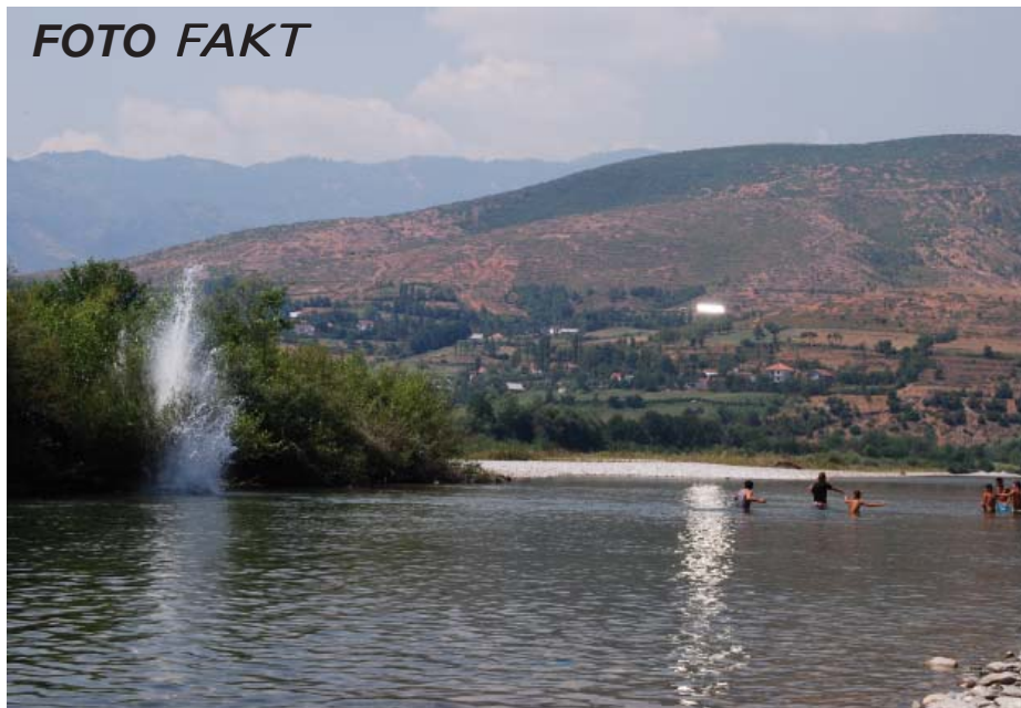
Gjuetia me dinamit, një modë e zakonshme e kapjes së peshkut në Drin...