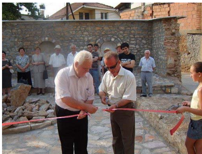
Gjatë përrimit të Galerisë së Arteve

sipas tij, që nga lashtësia adhuron zjarrin si perëndinë e vet, duke e ruajtur me fanatizëm si dicka të shenjtë nga aspekti i dobisë, por edhe nga rreziku që mund të shkaktojë. Për shkak të zjarrit lindi edhe votra e zjarrit, e cila në fillim që vendosur në mes të dhomës dhe më vonë në ballë të dhomës, duke i lënë një vrimë vertikale nga ku dilte tymi mbi çati. Kjo skutë u pagëzua oxhak. Dikur oxhaq mund të ndërtonin vetëm familjet e pasura, sepse oxhaku ishte edhe simbol i familjeve me pozitë të lartë në shoqëri. Disa fise dibrane që zotëronin pushtet në zona të ndryshme janë qua-