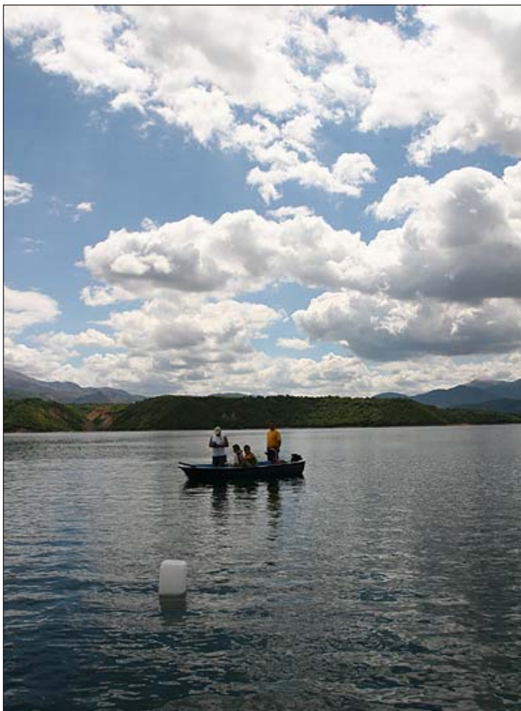
Tek klubi i Kajakut ne Diber (kayakradika.com) u mbajten gara sportive ne te cilen moren pjese kajakiste nga Bullgaria, Greqia, Oheri, Struga etj. Ishte nje dite metevertet e bukur. Nga opinjoni personal...mendoj qe ki klub eshte me shume per ta nderuar, pasi metevertet punojne!

Puhiza e korrikut sikur nuk kishte të ndalur, por edhe fjalët e kryetarit të shoqatës Ekologjike “Deshat” në Dibër nuk u shterën, por ne ndamë dhe zhgaravitëm në letër disa nga kontributet e kësaj shoqate, të cilat mendojmë që kanë dhënë shumë në ruajtjen dhe përparimin e mjedisit jetësor në Dibër.